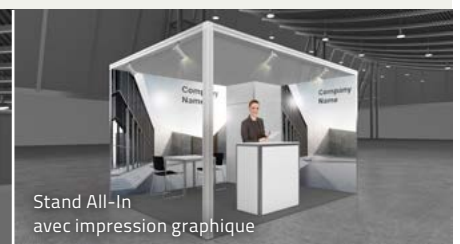
Stand All-In avec impression graphique