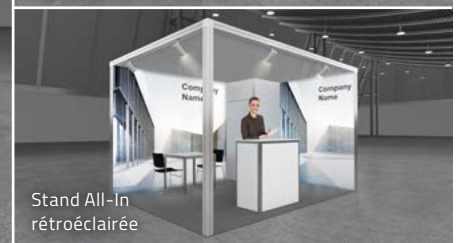
Stand All-In rétroéclairée

Les champs marqués d'un astérisque (*) sont obligatoires et doivent être remplis.